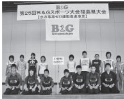
水泳スポーツ少年団(後列)、剣道スポーツ少年団(前列)の皆さん

小野町からは剣道スポーツ少年団と水泳スポーツ少年団が出場し、熱戦を繰り広げた結果、水泳の部、剣道の部でそれぞれ4位になりました。