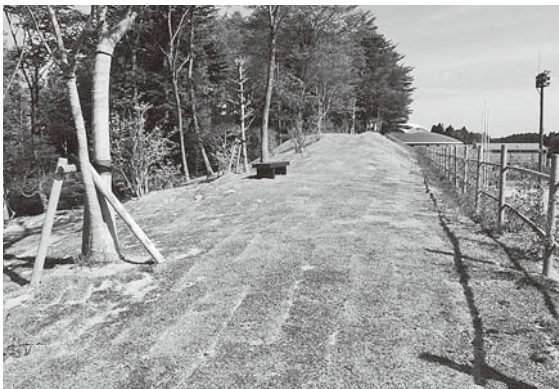
整備された憩いの場

運動公園内に「憩いの場」を整備しました。 子ども達とのふれあいの場・高齢者のふれあいの場として、町民の皆さんから公園整備について要望があり、平成20年度事業で新たに公園を整備したものです。 公園は芝生が敷きつめられており、初夏にはまるで緑のじゅうたんのようになります。 また、周りは小野町の花であるツツジの垣根を整備し景観に配慮した空間になっています。 ご家族でぜひお越しください。