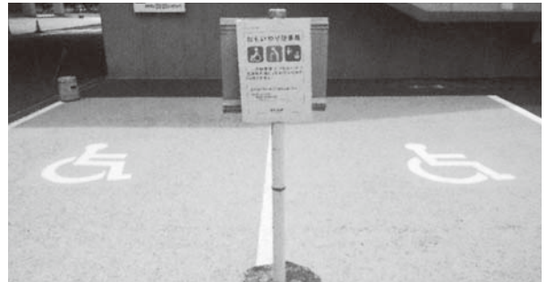
おもいやり駐車場