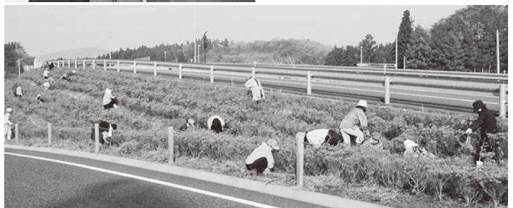
表彰式の様子(上) 除草作業の様子(下)