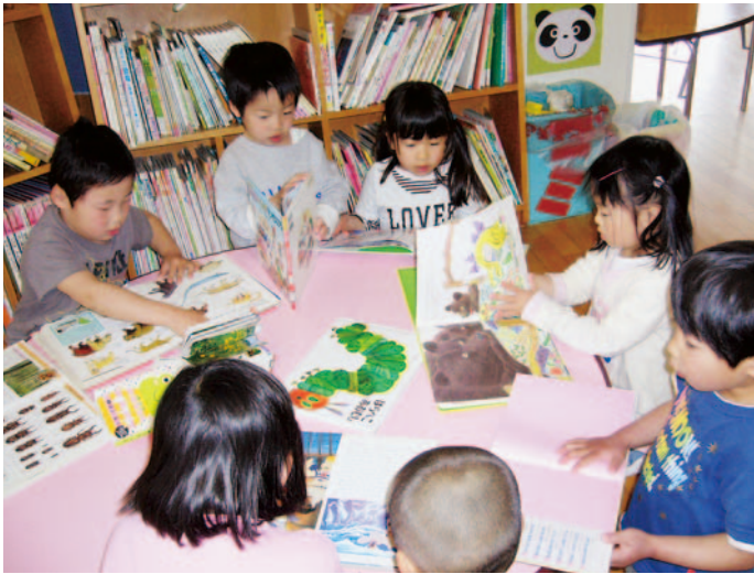
仲良く絵本を読む子ども達(夏井おおすぎ保育園)