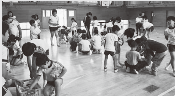
夏井第一小学校での様子