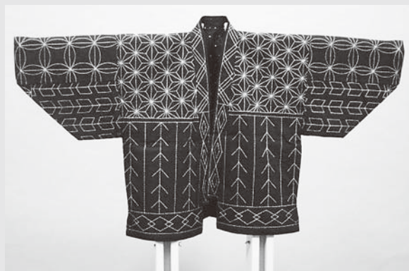
サシコジバン(南会津町) 復元

今回の展示では、福島県立博物館で収蔵している福島県内の仕事着や、それに関連した郷土の資料をご紹介します。ぜひご覧ください。