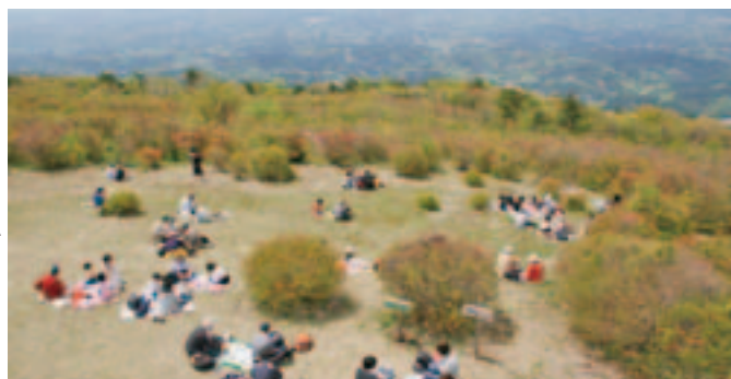
雄大な景色を見ながらの昼食