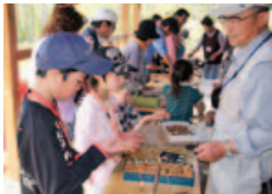
木の実クラフト体験