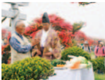
玉串を捧げる登山者代表