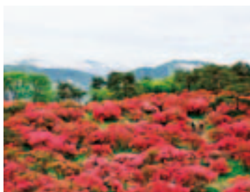
山頂に広がる紅のじゅうたん

5月25日、高柴山の山開きが行われました。訪れた約700名の登山者は、山頂一面に広がるヤマツツシを満喫しました。安全祈願祭の後は、思い思いの場所にシートを広げ、お弁当を囲みながら家族や友人との会話を楽しんでいました。