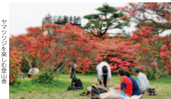
ヤマツツシを楽しむ登山者

5月18日、矢大臣山の山開きが行われました。さわやかな汗をかきながら、約350名の登山者が訪れ、山頂からの雄大な景色や新緑を満喫しました。当日は、毎年実施されている夏井第一小学校三世交代事業「すぎのこ」学級も行われ、児童や保護者も登山をし、休日を楽しんでいました。