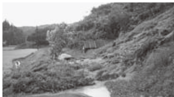
台風9号の影響による災害

このうち、直接負担していただいている町税は、最も重要な収入財源で、平成19年度末の予算額は、10億2,774万1,000円となりました。これを町民一人あたりの負担額に換算すると、8万4,979円になります。(第1図参照)