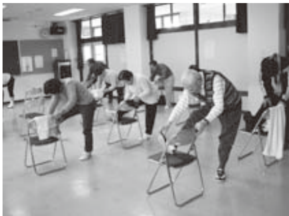
ヘルスアップ教室