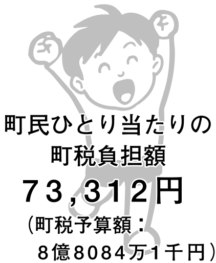
第1図 町民ひとり当たりの町税負担額の推移