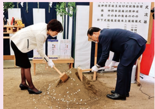
くわ入れをする琴田理事長(左)と町長