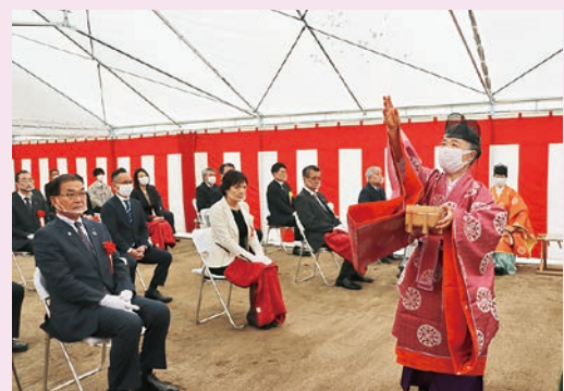
宮司によるお祓い