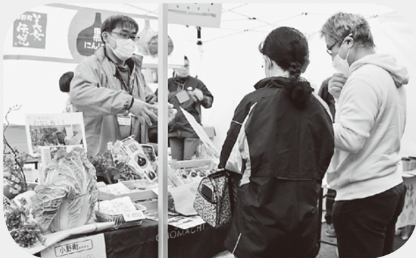
西会津でのイベントの様子

それでもいただいた種や苗をうまく育てることができず、全滅させてしまったこともありました。そんな時でも後ろ向きになることがないよう導いていただきました。