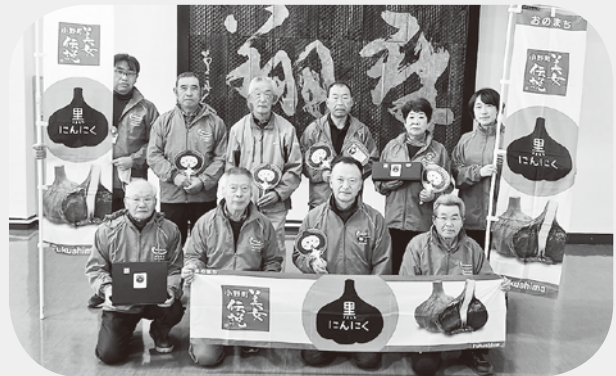
ペルサルーテの皆さんと

めっきりと寒くなり新型コロナウイルス感染症だけでなく何かと体調を崩しやすい季節からではありますが、どうか皆さんご自愛ください。