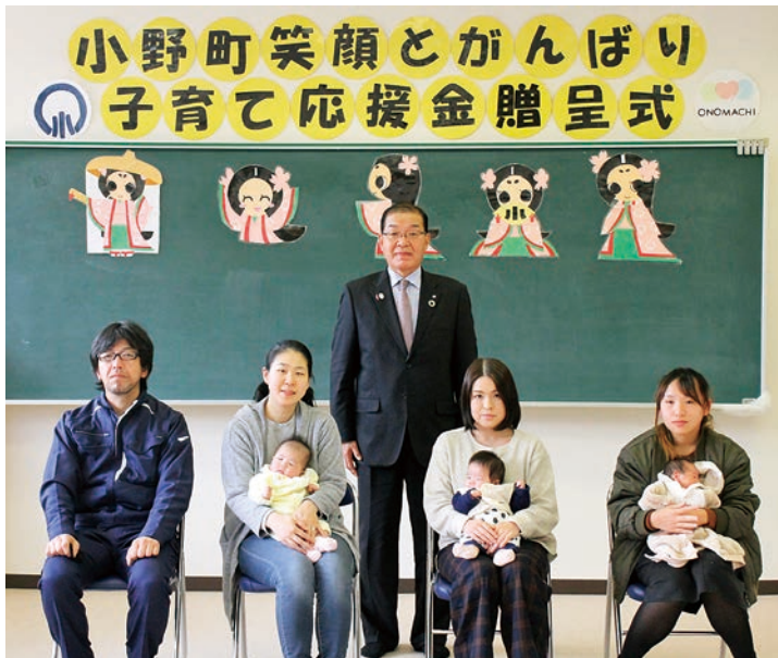
贈呈を受けた皆さん

小野町笑顔とがんばり子育て応援金贈呈式が昨年12月22日、子育て支援課キッズルームで行われました。新たな町民の誕生を祝福し、赤ちゃんの健やかな成長を願い、町長から一人ひとりに「応援金」と、町有林の間伐材で作られた子ども用いす「おめでたいっすー」および乳児期から読書にふれてもらうための「絵本