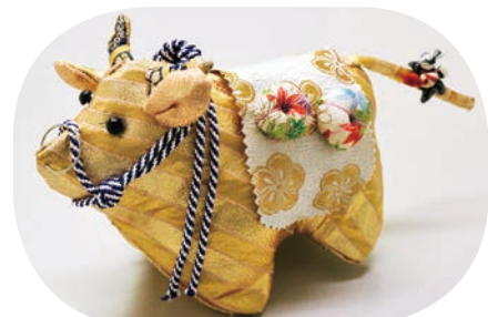
寄贈いただいた丑の人形