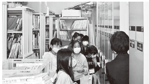
まるごと文化の館講座の様子

第1回目は文化の館のバックヤードツアーが行われました。参加者は普段は見られない文化の館の裏側を見学し、講座への期待を膨らませていました。