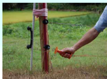
侵入防止柵の設置