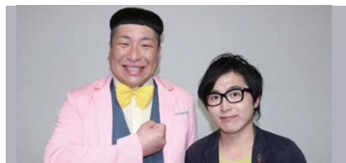
お笑いライブ/ぺんぎんナッツ