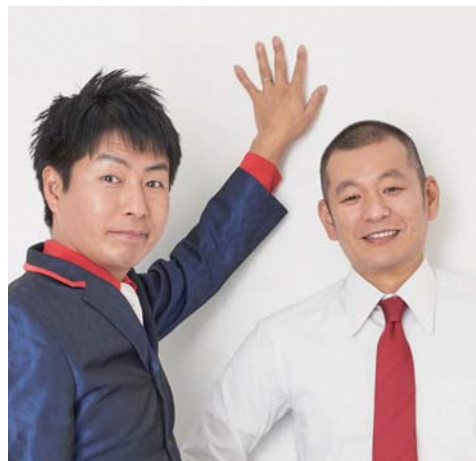
お笑いライブ/U字工事