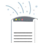
フロン入り除湿機

※フロン入り除湿機は、フロン回収業者によりフロンを回収した場合は、もやせないごみ専用袋に入る場合は【もやせないごみ】として出すことができます。もやせないごみ専用袋に入らない場合は、【粗大ごみ】になります。いずれの場合もフロン回収済証を貼り付けてください。