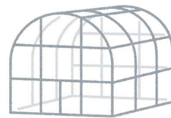
ビニールなどの農業廃材