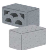
コンクリート廃材