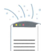
フロン入り除湿機

※フロン入り除湿機は、フロン回収業者によりフロンを回収した場合は、もやせないごみ専用袋に入る場合は【もやせないごみ】として出すことができます。もやせないごみ専用袋に入らない場合は、【粗大ごみ】になります。いずれの場合もフロン回収済証を貼り付けてください。