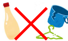
マヨネーズの容器 バケツやハンガー