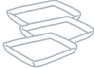
惣菜などのトレイ

汚れや油（オイル）がひどいものは、【もやせるごみ】に出してください。 また、ペットボトルとは、「プラスチック類・ペットボトル専用袋」を別にして出してください。