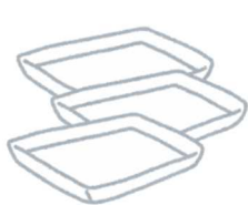
お惣菜などのトレイ

また、ペットボトルとは、プラスチック類・ペットボトル専用袋を別にして出してください。