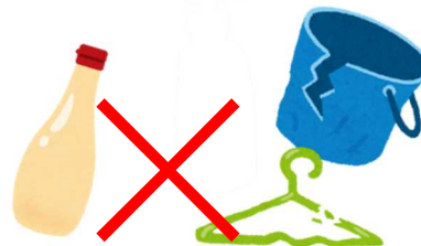
マヨネーズの容器