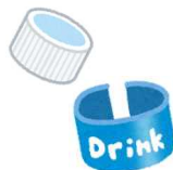
ペットボトルの キャップ・ラベル