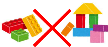
プラスチック製のおもちゃ