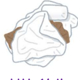
リサイクル できない紙類