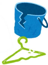
プラスチック製品

生ごみは水分を切ってから出してください。 紙おむつの汚物はトイレに流してください。 木片やせん定した枝等は、長さ 60cm、太さ 10cm 以内に し束ねてもやせるごみ専用袋に入れてください。 袋に入らない場合は【粗大ごみ】になります。