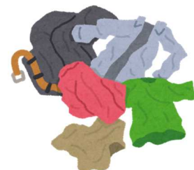
古着のリサイクル等