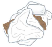
リサイクル できない紙類