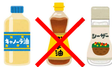
油分(オイル)のびん 汚れの落ちないびん