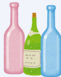
その他の色のびん