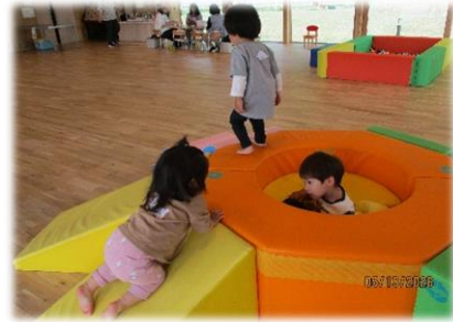
いっしょにあそぼう♪