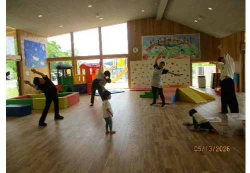
親子でストレッチ～！