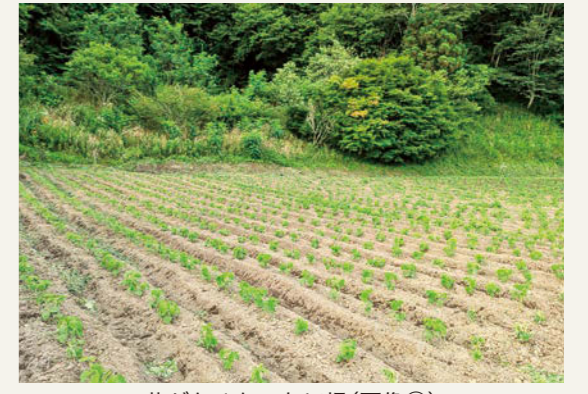
草がなくなったほ場(画像③)

一人ではとてもできそうにないと思っていたところ、それを察知した味噌部会の方々が駆けつけて、あっという間に草の処理を終わらせてくださいました。草がなくなったほ場のあまりのきれいに驚きました(画像③)。長年畑をやっている方の手際の良さは素晴らしいです。