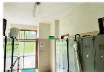
▲多数のひび割れ(1階)