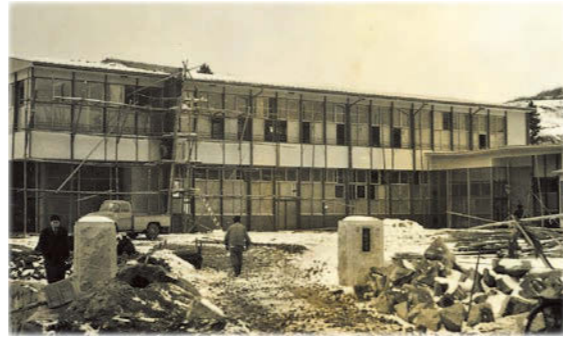
▲小野町役場完成間際