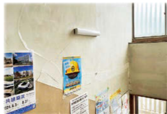
▲多数のひび割れ(2階)