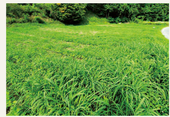
雑草が生い茂ったほ場(画像②)

さっそく大豆づくりの話をさせていただきました。まずは伸びきった草を刈り、フォークを使って取り除きました。その後、耕うん機で畑を耕して畝たてをしました。道具や機械の使い方も分からないため、その都度親切に教えていただき順調に進みました。今までの作業で一番衝撃を受けたのが、草の生育の早さです。種まきが終わり、雨も降ったため安心して週末を過ごしていたところ、畑を借