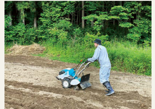
ほ場での作業(画像①)

さて現在の活動報告です。私は小野町の農産物を使った6次化商品「味噌」の原料となる大豆を味噌部会のメンバーと一緒に栽培しています。農業は未経験のため、元JA営農指導員の方にご指導いただきました。ながら、ほ場での作業を進めています(画像①)。