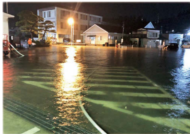
▲令和元年 台風19号による駐車場冠水被害

そして現在まで庁舎機能を維持しながら本町を支えてきましたが、時の流れと度重なる被災により、建物の限界が近づいているのが現状です。