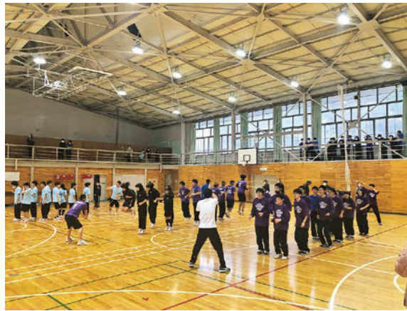
▲ 生徒会レクリエーションの様子