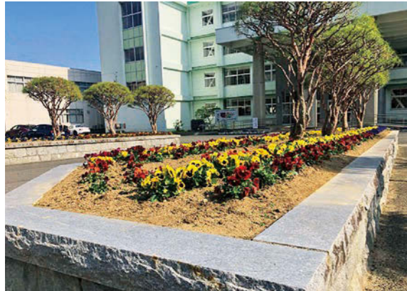
▼ 2年生選択授業の様子