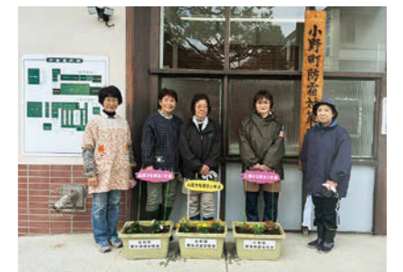
小野町更生保護女性会の皆さん