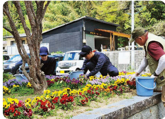
正門前の花壇にパンジーを植えている生徒