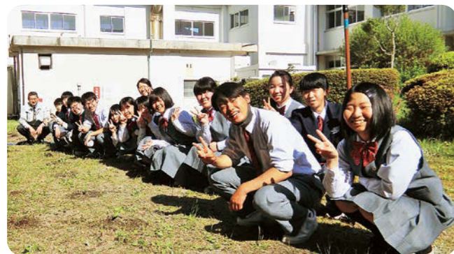
中庭にヒマワリを植えている生徒たち