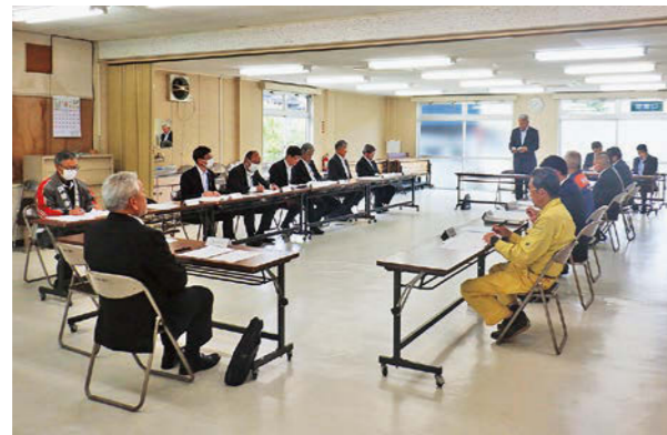
水防協議会の様子