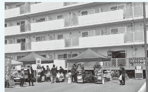
つどってまるしえの様子

また移住・定住支援以外の活動では、つどっておのまちのガーデン植栽は私の楽しみのひとつで、花や野菜の手入れをする時間はいつも気持ち明るく和やかにになります。昆虫が集ま