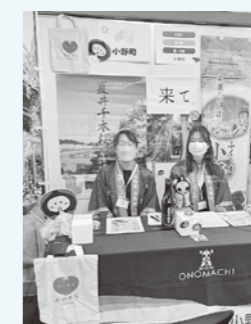
移住相談会の様子

深く深く感じています。今年度は何が起ころるか、町民の皆さんの活躍が私も楽しみです。今後も移住・定住分野の活動に取り組みでまいりますので、引き続きよろしくお願ひします。