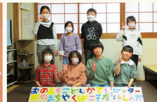
センターの看板を作ってくれた放課後児童クラブの児童の皆さん