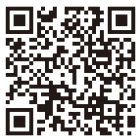
福島労働局ウェブサイト