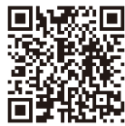
福島県ウェブサイト