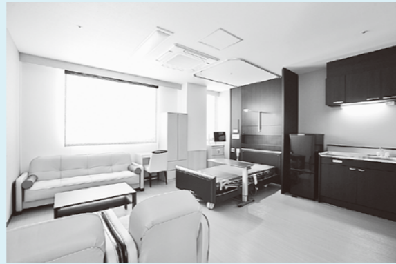
緩和ケア病床病室

緩和ケア病床についてのお問い合わせは、患者サポート室で受け付けています。 (月曜から金曜の午前9時から午後5時まで (祝祭日除く))