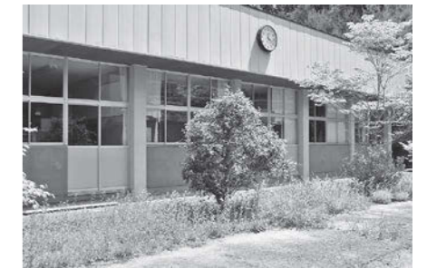
小野町公民館雁股田分館