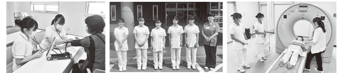
高校生一日看護体験の様子