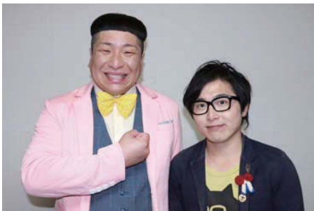
お笑いライブ 午前の部 11:10~11:30 ぺんぎんナッツ