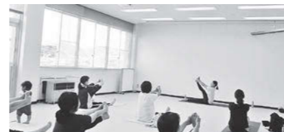
ママのリフレッシュ教室