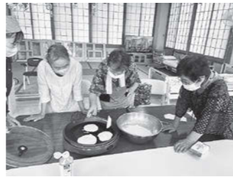
第2回オレンジカフェの様子

また9月の「世界アルツハイマー月間」では、認知症の啓発活動として、ふるさと文化の館図書館に特設コーナーを設置させていただきました。