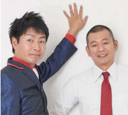
お笑いライブ 午後の部 14:30~15:00 U字工事

10/27日 ●時間/9:00~15:30 ●会場/小野町町民体育館・小野町B&G海洋センター