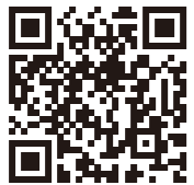
磐越東線キャッチコピー募集QR

また磐越東線のキャッチコピーを募集しています。採用された方には、沿線市町の素敵な商品をご用意しています。詳しくは、QRから応募フォームなどをチェックしてください。