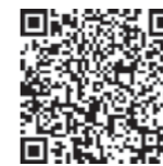
町公式ウェブサイトQR

■応募書類 指定管理者公募に関する「要項」「仕様書」「様式」は、町公式ウェブサイトからダウンロードいただくか、公民館で配布します。