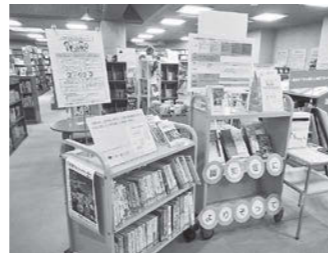
認知症特設コーナー