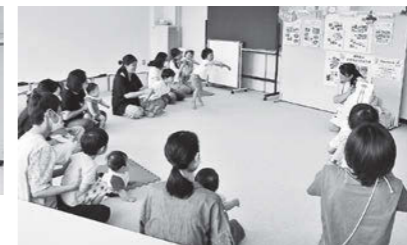
親子ふれあい教室