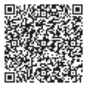
社会福祉協議会ウェブサイトQR

申込用紙は、小野町社会福祉協議会で交付します。またウェブサイトでダウンロードできます。