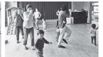
幼児のわくわくタイム