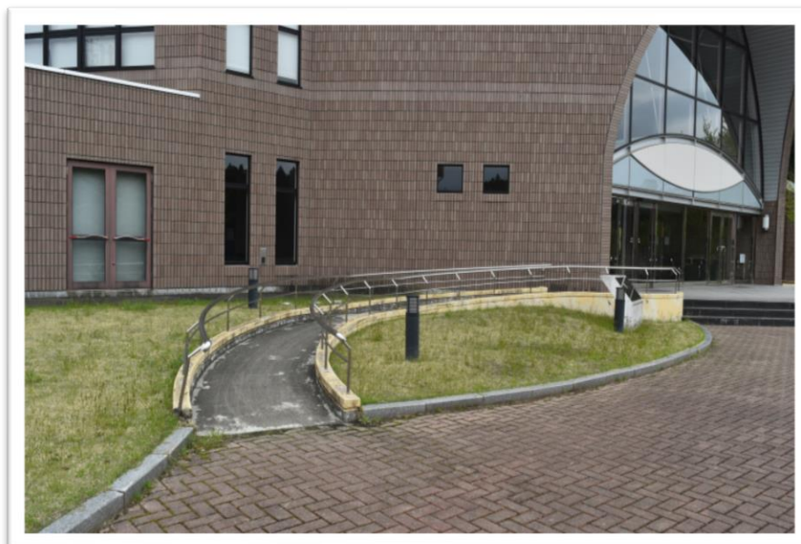
③スロープ（町民体育館）