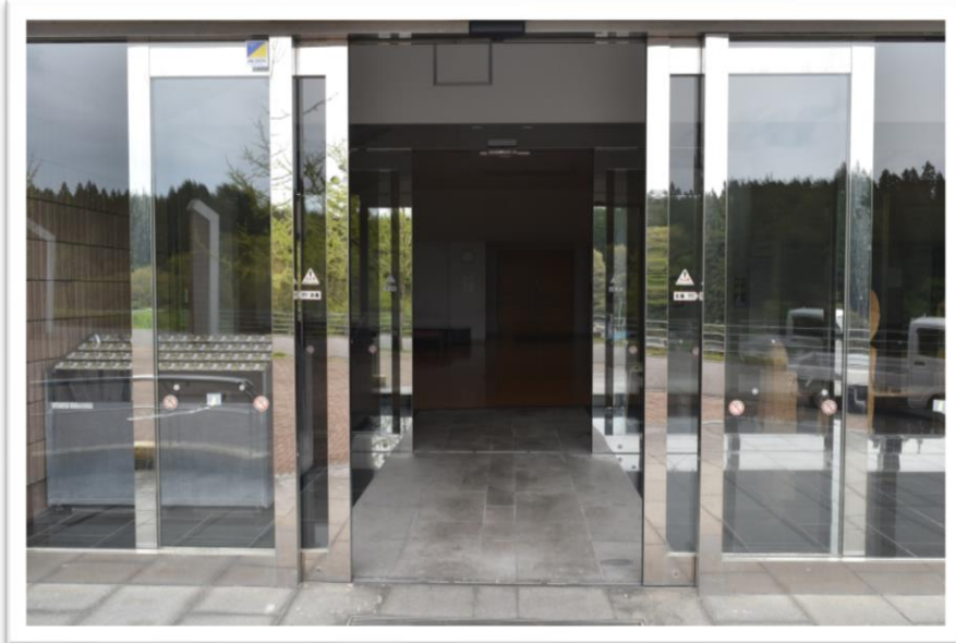
②搬入口（町民体育館から搬入） （正面自動ドア+左に折れてもう一つ自動ドア）