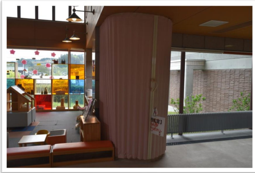
①現授乳スペース（設置予定場所）