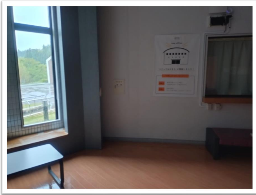
①ロビー壁面（設置予定場所）