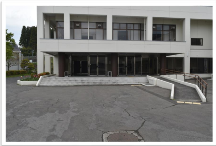
①多目的研修集会施設