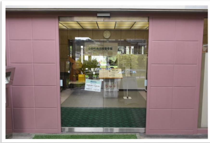
②搬入口 （正面自動ドア+左に折れてもう一つ自動ドア）