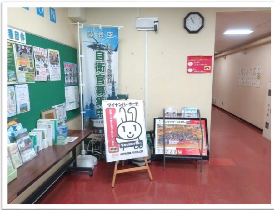
①ロビー壁面（設置予定場所）