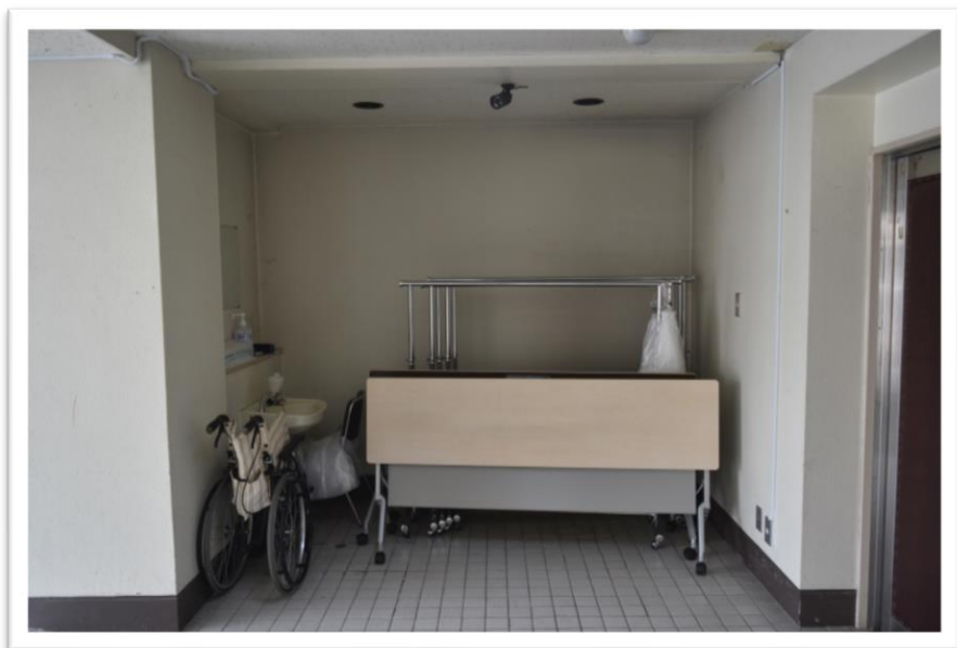
①大ホール前ロビー（設置予定場所）