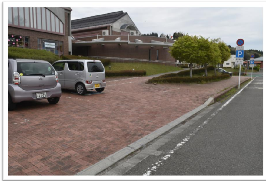
②ふるさと文化の館