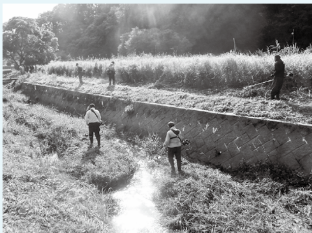
クリーンアップ作戦の様子