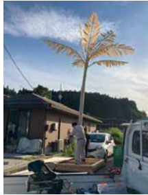
手作りしたヤシの木や葉を会場に運んで組み立てました！