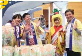
石垣島直送のパン販売ブースも大 人気で完売に！