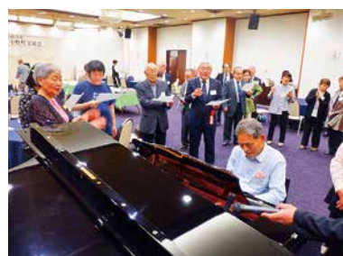
ピアノ伴奏による合唱の様子