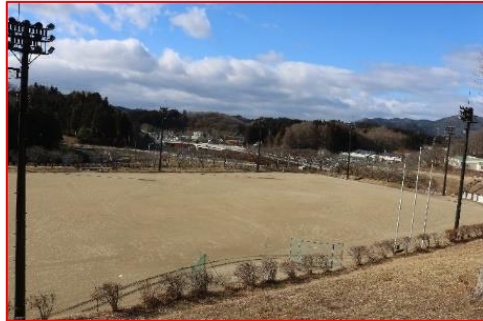
③多目的グラウンド