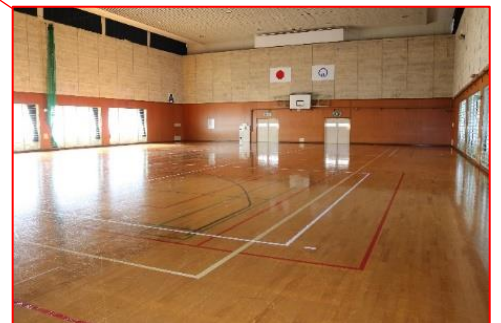
①B&G海洋センター (体育館)