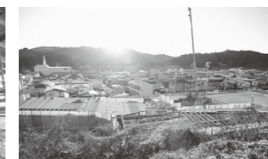
木造軸組建方完了(上棟・全景)