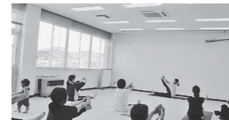
ママのリフレッシュ教室

参加を希望する方は町の健康カレンダーをご確認の上、事前に電話で申し込みください。