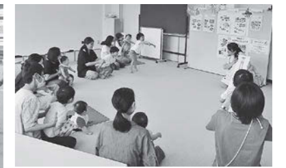
親子ふれあい教室