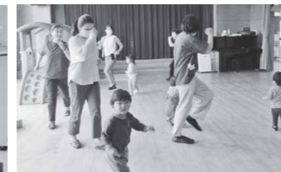
幼児のわくわくタイム