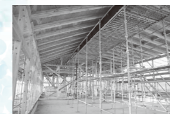
木造軸組建方完了(上棟)