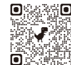
町公式ウェブサイトQR