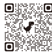
町公式ウェブサイトQR