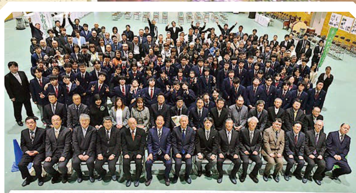
小野高校84年間ありがとう! 福島県立小野高等学校 閉校式 令和8年3月19日(木)

小野高校としての歴史は閉じましたが、あぶくま柏鷲高校小野校舎として今後2年間、在校生が小野校舎で学校生活を送ります。今後とも小野校舎での教育活動にご協力いただけますようお願い申し上げます。