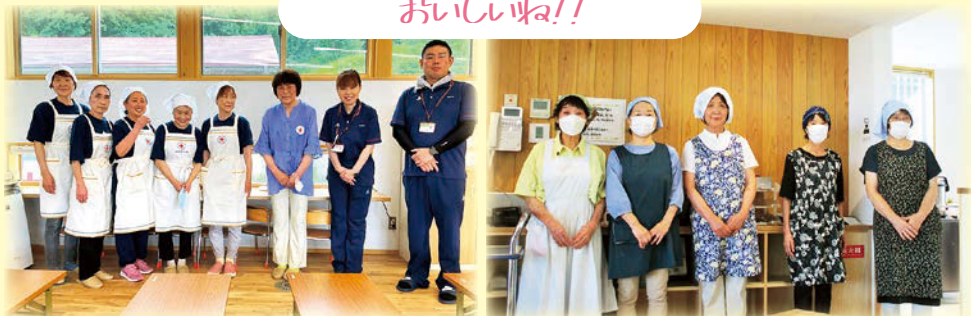
日赤おみれ会の皆さん