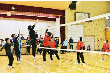
ソフトバレーボール

昨年12月17日、スポーツ大会が開催されました。本校で3学年がそろって開催されるスポーツ大会は今回で最後となります。競技種目は、ボールのかわりにソフトfrisビーを使用するドッジビーとソフトバレーボールの2種目で、どちらも会場には笑い声と歓声、そして悲鳴があふれ、1年の締めくくりとして、とても楽しい1日を過ごすことができました。