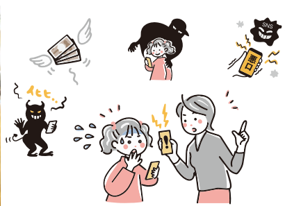
情報モラル教室の様子