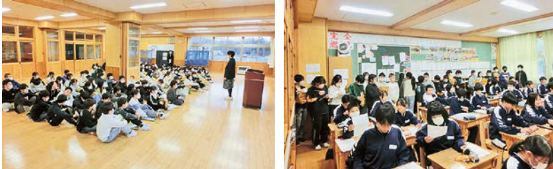
新入生オリエンテーションの様子

今回は2月24日に新入生オリエンテーション②を実施予定です。このオリエンテーションを通して、中学校の様子を少しでも感じてもらい、安心して入学できるよう準備を進めてまいります。