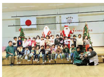
クリスマス会の様子

楽しみにしていたクリスマス会！ 昨年12月19日、こども園のクリスマス会が行われました。園長先生が「サンタクロースは何に乗って来るの？」と子どもたちに質問をすると「トナカイに乗って空を飛んでくるの!」とうれしそうに答えていました。 その後は、先生方によるハンドベル演奏と子どもたちによるダンスが披露され、全員で楽しく時間を過ごしました。やがて鈴の音が聞こえてくると、サンタクロースが登場し、大きな歓声がわき上がりました。白くて大きな袋に入ったプレゼントが一人ひとりに手渡され、うれしそうな姿がたくさん見られたクリスマス会となりました。