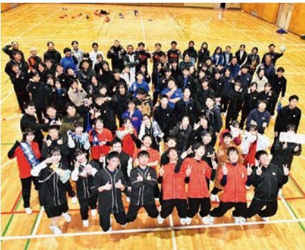
全校生での記念撮影