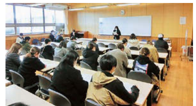
学年懇談会の様子