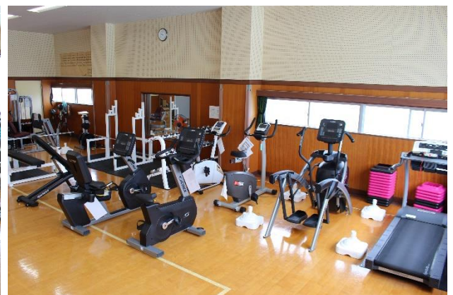
有酸素運動用マシン