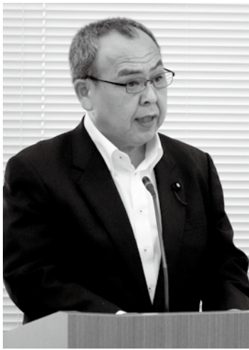
議員 一順 分國