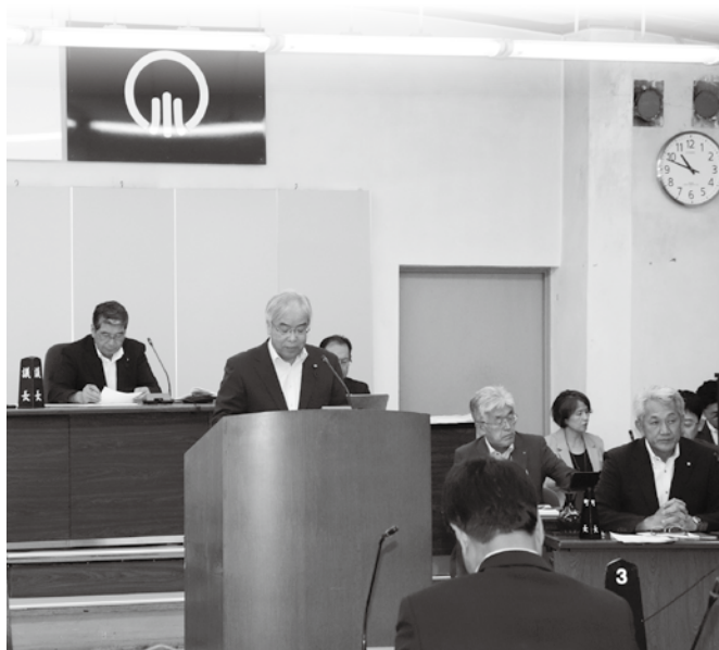
▲本会議の様子（監査報告）

令和6年小野町議会定例会9月会議は、9月5日から13日まで9日間の日程で開かれました。