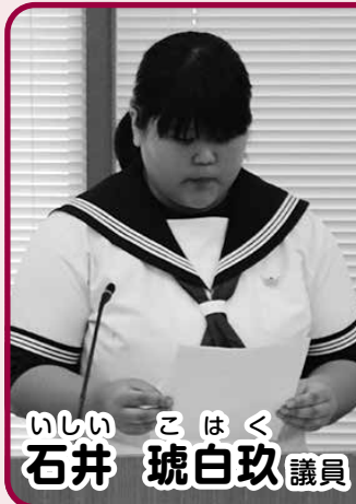
いしい こはく 石井 琥白玖 議員

町の情報や名所紹介動画を複数回に分けて投稿することや、クイズを出題するなど、戦略的な考え方を参考に効果的な情報発信に取り組んでまいります。