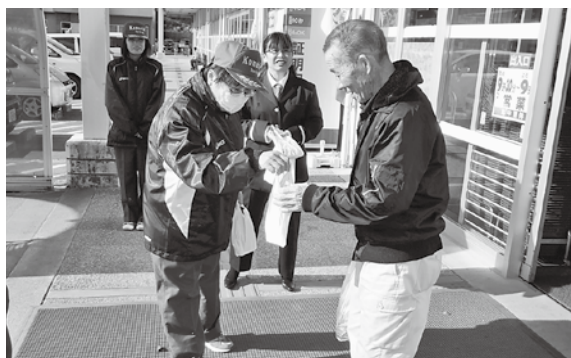
同日行われたこまち女性消防隊による火災予防啓発活動の様子