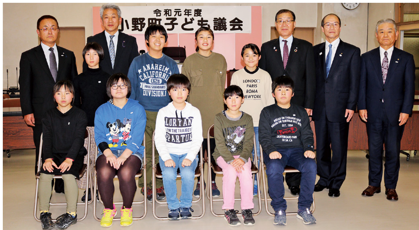
子ども議会に参加された皆さん

小野町子ども議会が昨年12月17日に役場議場で行われ、町内全小学校の6年生10人が参加しました。