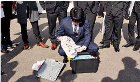
タイムカプセルを開けました