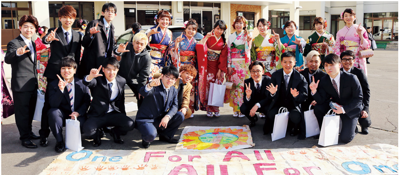
タイムカプセルに入っていた旗と一緒に