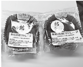
販売した米粉黒糖マドレーヌ

両校の交流は、生徒が貴重な体験をするだけでなく、新しい特産品の開発をはじめさまざまな分野での関係をつくり上げるものであり、今後の友好関係発展と活躍を期待します。