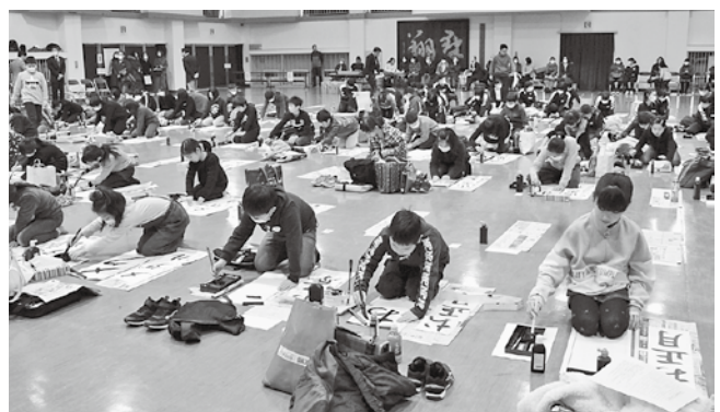
書きぞめ大会の様子