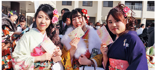
タイムカプセルに入れた手紙と