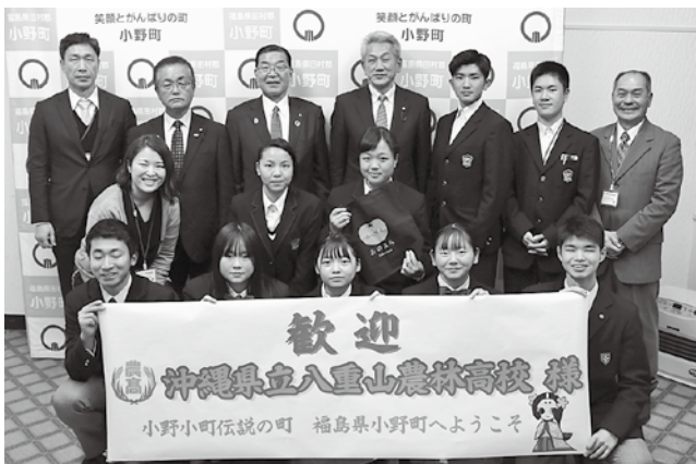
役場を訪れた八重山農林高等学校と小野高等学校の皆さん

※「米粉黒糖マドレーヌ」は、小野高等学校と八重山農林高等学校が、小野高等学校で栽培された米から作った米粉と、石垣市産の黒糖を使い、共同で開発した6次化商品です。