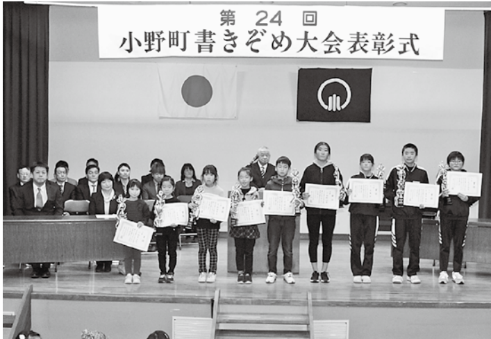
大賞を受賞した皆さん

町と小野町青少年育成町民会議主催の「第24回小野町書きぞめ大会」が1月19日、多目的研修集会施設で行われました。これは日本の伝統文化である書道に親しんでもらうことを目的に毎年開催しているものです。大会には町内の小・中学生88人が参加し、学年ごとに決められた課題に真剣に取り組みました。