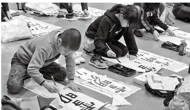
真剣に取り組んでいます