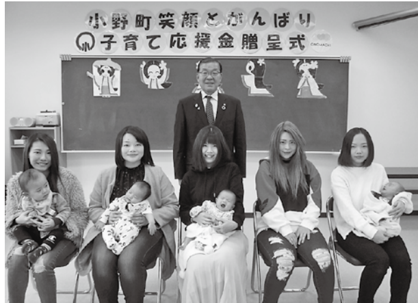
応援金などの贈呈を受けた皆さん