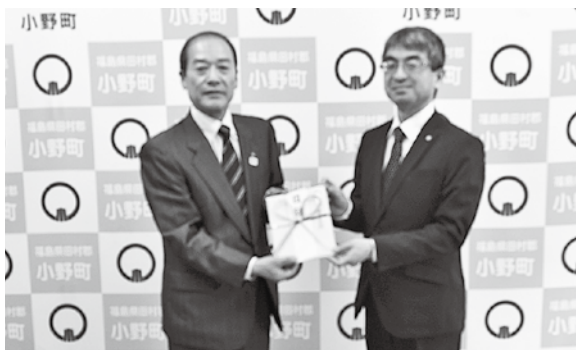
副町長と奥崎所長(右)

地域社会の安全・安心な明るいまちづくりを目的とし、東北電力株式会社郡山電力センター様から、1月16日、LED防犯灯15基を寄贈いただきました。