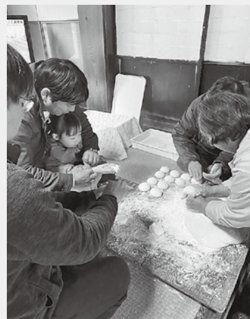
つきたてのお餅をいただきました

写真はそのご一家との風景で、お孫さんが小さな手でこねているのが、とてもかわいかったです。