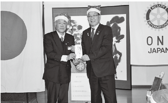
中原小野ロータリークラブ会長(左)と町長

このたび、小野ロータリークラブ様から文化・体育振興基金にご寄付をいただきました。