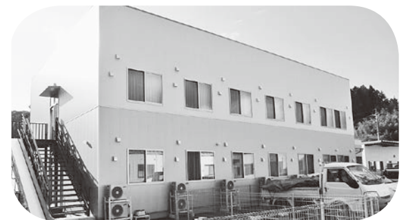
グループホームきずな