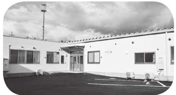
特別養護老人ホームつつじの里