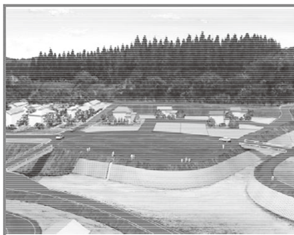
右支夏井川、車川合流部を望む

◎ 県中建設事務所 河川砂防課 ☎ 024-935-1438 ◎ 地域整備課 ☎ 72-6937