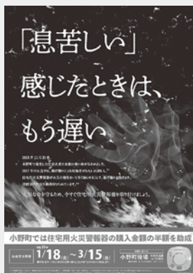
火災警報器のチラシ兼ポスター

このようなデザインをしている私ですが、チラシ作りのポイントを1点。それは情報が整理されていること。そろえる・まとめる・優先順位をつける。これを守るだけで資料がグッとわかりやすくなるかもしれません。ぜひ一度お試しください。