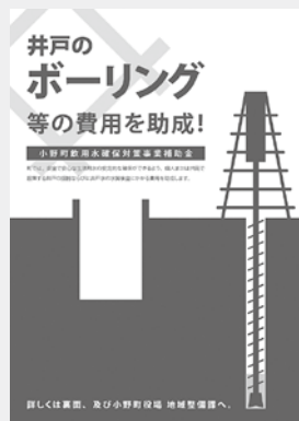
ボーリングのチラシ