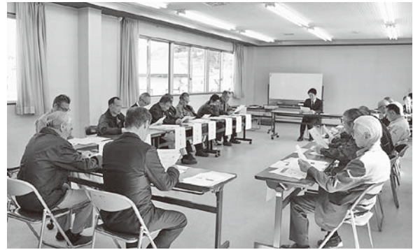
事故防止講習会の様子