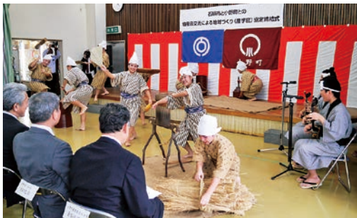
八重山農林高校郷土芸能部の演舞