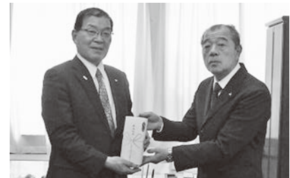
町長(左)と大和田郡山法人会小野支部長

献血にご協力いただいた皆さん、各種団体の皆さんに紙上よりお礼を申し上げます。次年度もご協力をお願いします。