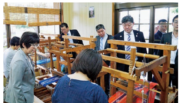
ミンサー工芸館視察の様子