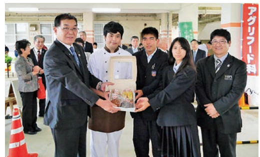
農林市での共同開発商品贈呈式

訪問交流団は沖縄県滞 在、八重泉酒造、ミンサー 工芸館や6次化に取り組む ミルミル本舗、さらにはB &G財団の研修施設などを 視察しました。