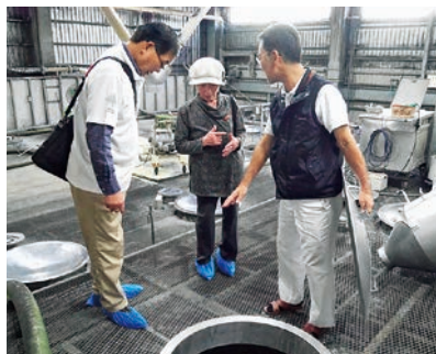
八重泉酒造視察の様子