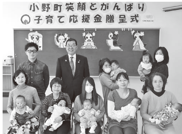
応援金などの贈呈を受けた皆さん

応援金の贈呈を受けたお子さんは次のとおりです。(平成30年3月から平成31年1月生まれの方・敬称略・誕生順)