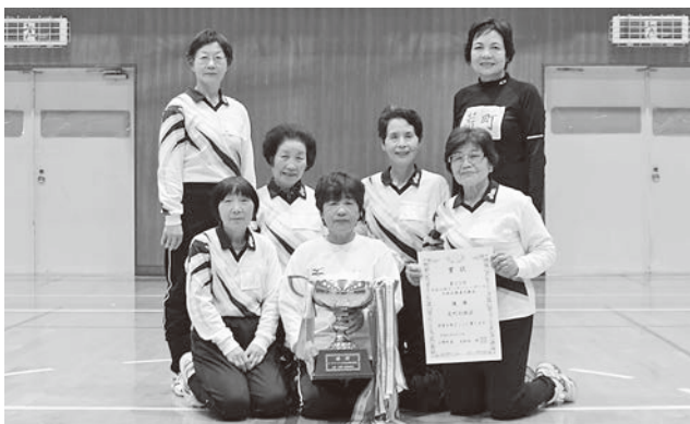
(ビーチバレーボール行政区親善交歓会)荒町行政区チームの皆さん