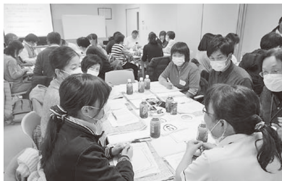
ディスカッションの様子

院長の講話では「地域包括ケアシステムと病院の役割」と題して、地域包括ケアシステムの必要性や当院の役割・目標について講義を行いました。またグループディスカッションでは「地域における病院の役割、ミッションとは？」をテーマに、各グループごとに、地域における病院のあり方について意見交換を行い、まとめた内容を全体で共有しました。