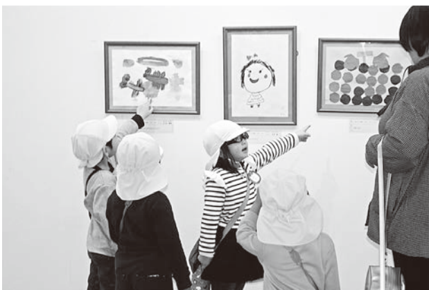
作品を鑑賞するつつじ児童園の子どもたち

卒園児絵画展が2月16日(土)から24日(日)まで行われました。家族連れが多く訪れ、写真を撮影したり、熱心に鑑賞していました。