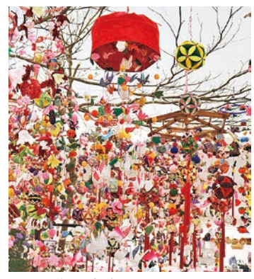
おのタウンコムコム