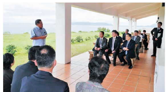
ミルミル本舗視察の様子

〈今後の展開〉協定に基 づく特産品開発と共同 PR) 協定に基づき、小野 町・石垣市は、地元産品 の情報交換を行うとともに に、それらを活用した特 産品開発や販売PRを推 進します。その際、民間 事業者やそれぞれの高校 の協力・参画を求め産学 官(産業分野・学術分野・ 行政)が連携し取り組ん でいきます。