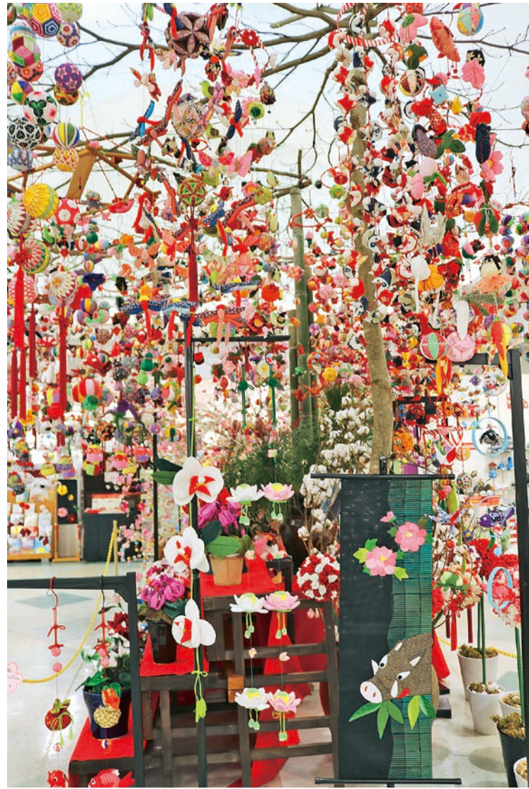
手作りのつるし雛

会場には、手芸サークルの皆さんによる丹精込めた見事な「つるし雛」などの作品がたくさん飾られ、期間中は町内をはじめ県内外から大勢の方々が訪れました。