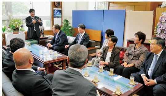
八重山農林高校訪問の様子

折りしも学校行事「農林 市」が開かれており、その中 で、小野高校と共同開発し た黒糖マドレーヌなどが生 徒代表から訪問交流団に贈 られました。小野高校と八 重山農林高校は3年前から 互いの産品を活用した特産 品の開発交流を行っていま すが、今後も両校の交流を 推進していく方針が確認さ れました。