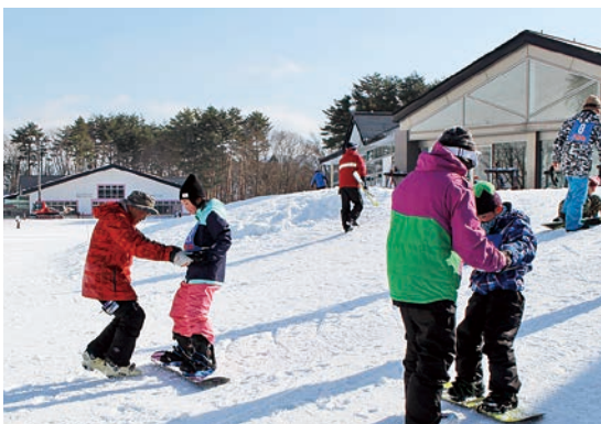
スノーボード教室の様子

当日は天候にも恵まれ、ゲレンデのコンディションもよく、絶好のスキー・スノーボード日和となりました。