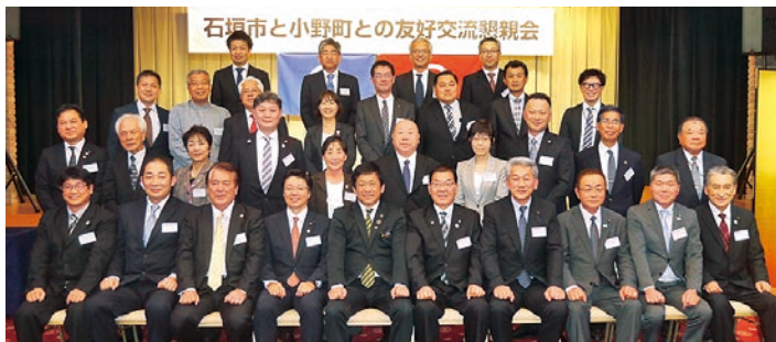
友好交流懇親会の様子