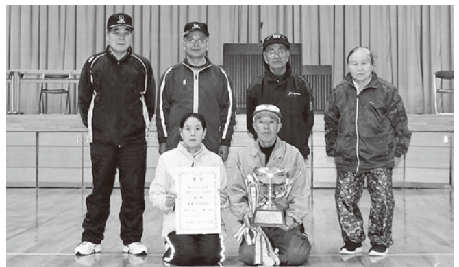
(室内ゲートボール大会)飯豊上行政区Bチームの皆さん