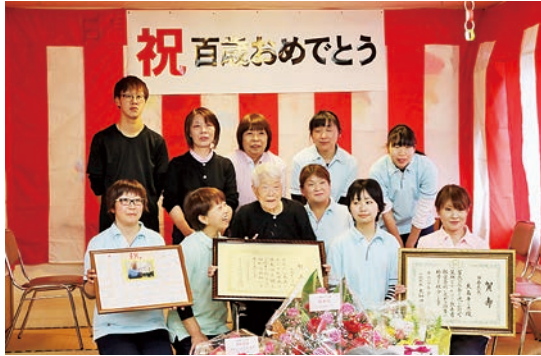
グループホームさくらんぼの皆さんと

町から町賀寿ならびに敬祝金、県からは県知事賀寿ならびに木杯、町議会、町社会福祉協議会から花束がそれぞれ贈られました。