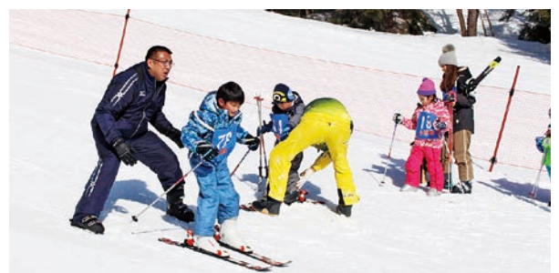
スキー教室の様子

参加者全員で準備体操をしたあと、スキーとスノーボードの各コースに分かれて指導を受けました。今回は初めてスキーやスノーボードを経験する参加者が多く、指導員から滑る、止まる、曲がるなどの基本を学び、体が慣れてくるとゆっくりと斜面を滑り降りることもできるようになりました。