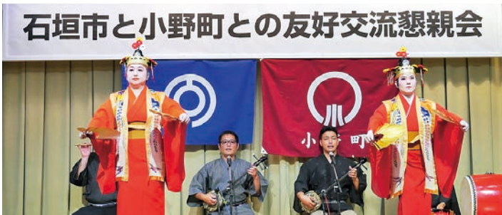
石垣市役所舞踊団の舞い

協定式に引き続き、交 流懇親会が開かれ、地域 の話題や特産品に関する 情報交換を行うなど交流 を図りました。また交流 会の最後には石垣市役所 職員舞踊団による舞いや 踊りが披露され、全員が 輪になって沖縄地方の踊 りを踊るなど懇親を深め ました。