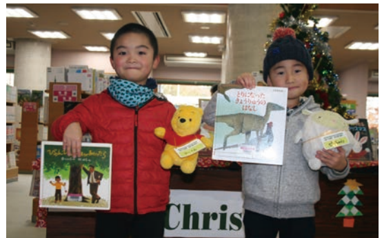
ぬいぐるみを迎えに来た子どもたち

としょかんぬいぐるみおとまり会が11月25日と26日に図書館で行われました。これは、子どもたちが大切にしているぬいぐるみを図書館に一泊させて、図書館体験をさせるというものです。翌日、ぬいぐるみを迎えに来た子どもたちは、自分のぬいぐるみが絵本を読んで館内で過ごす様子を撮影したアルバムをプレゼントされ、本への親しみをさらに感じたようでした。