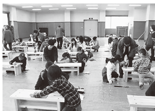
親子で作業をする様子

作業終了後は、参加した親子に家庭で手軽にできる「きのこの栽培キット」がプレゼントされました。