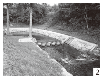
1_協定を締結した県中建設事務所・早渡地区の皆さんと町関係者 2_整備された「早渡ふじ公園」