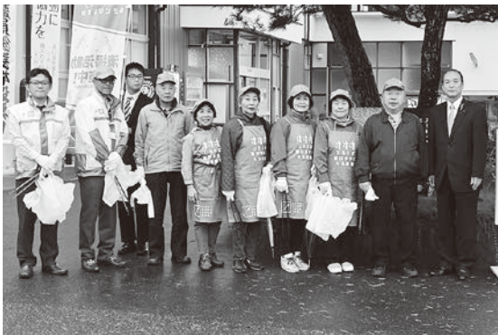
活動に参加された新福島たばこ販売協同組合田村支部の皆さん