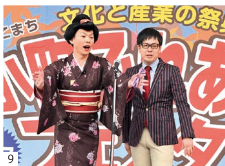
1_小野高校吹奏楽部による演奏/2_餅まき/3_小町夢太鼓の演奏/4_kaho*さんのステージ/5_HAPPYふくしま隊/6_フラダンスショー/7_鈴木尚広さんのトークショー/8_小町雪乃歌謡ショー/9_母心お笑いステージ