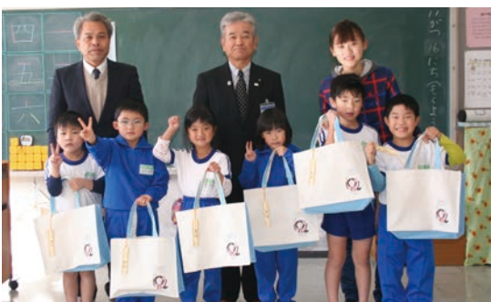
飯豊小学校1年生の皆さん

はじめに、教育長から「皆さん、たくさん本を読んで、本を好きになってください」とお話があり、子どもたちに自分が選んだ本一冊と小桜ちゃんがプリントされたオリジナルの図書館バッグが手渡されました。