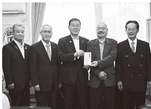
町長(中央)へ寄付金を手渡す紅晴美小野町後援会の皆さん

小野町文化・体育振興基金は、町の文化と体育の振興と充実を図るために個人や団体からの寄付により積み立てている基金です。