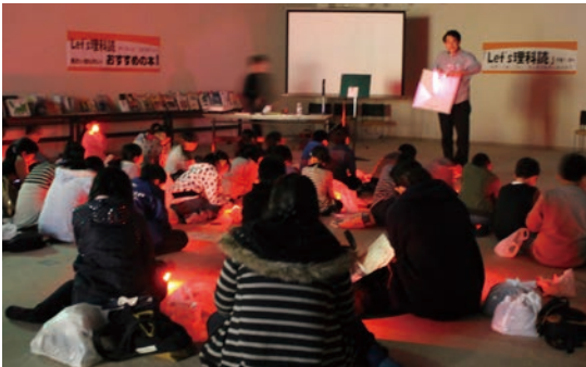
「Let's理科読」日時計作りを体験中

参加した約60人が実験や工作で楽しみながら学習しました。またこども図書館員による展示などもあり、多くの家族連れが図書や新聞に親しむ機会となっていました。