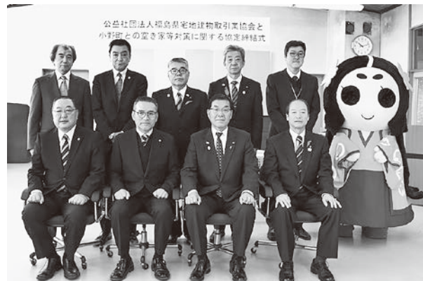
協定を締結した(公社)福島県宅地建物取引業協会の皆さんと町関係者

町では今後、福島県宅建協会と連携し、空き家・空き地を『売りたい・貸したい人』と『買いたい・借りたい人』をつなぐ「小野町空き家・空き地バンク」を本格稼働させ、町内に点在する空き家・空き地の利活用を図ってまいります。