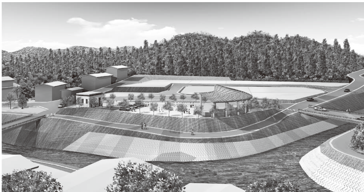
河川改修による車川合流付近の完成イメージ図(変更となる場合があります)