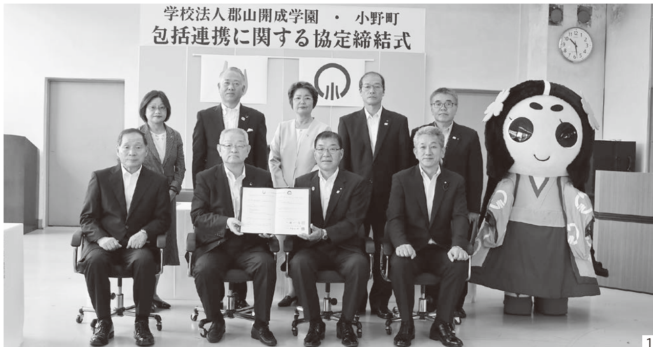
1_(前列)左から影山郡山女子大学副学長、関口理事長、町長、議長、(後列)左から先崎准教授、降矢事務局長、石村郡山女子大学短期大学部副学長、副町長、総務課長、小桜ちゃん