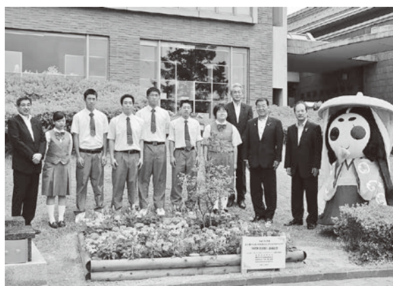
左から菅野総支社長、小野高校の生徒、町関係者

※主催者：福島民友新聞社、県森林組合連合会、農林中央金庫福島支店、県森林・林業・緑化協会