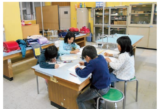
子ども教室の様子

1年間、各クラブや教室で異なる学年の友達と交流し、さまざまな遊びや体験を通して活動の幅を広げていきます。