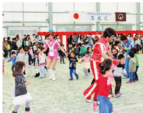
ふくしまキッズマンと子どもたち