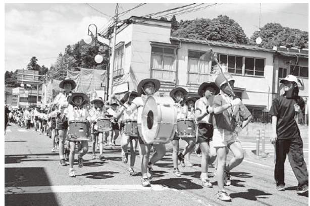
昨年度のパレードの様子