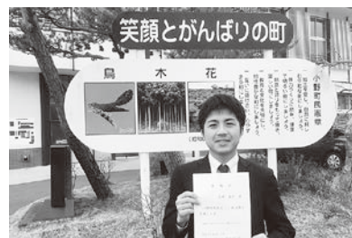
「町長から委嘱状を受け取りました。引き続きよろしくお願いします！」

3年目ということで盛りだくさんになりますが、協力隊の活動に一段と励んでまいります。