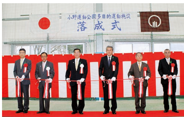
左から松崎県中地方振興局長、大千里教育委員長、大和田町長、村上議長、田谷福島復興局長、籠田小野町体育協会副会長