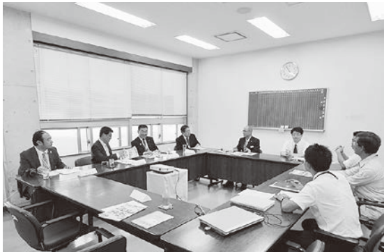
八重山農林高校での協議の様子