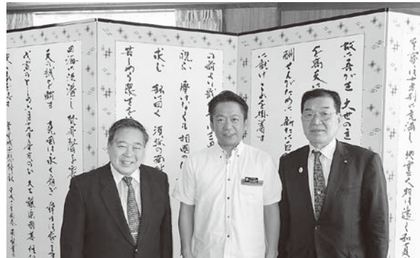
左から小泉武夫先生、中山石垣市長、大和田町長