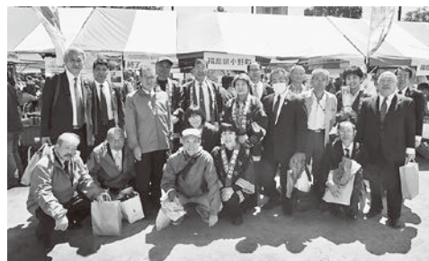
特産品P Rにご協力いただいた ふるさと小野町会の皆さん