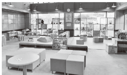
子どもの笑顔ひろば