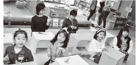
こどもの日おたのしみ会

小学生を対象にした「こどもの日おたのしみ会」が5月1日、子どもの笑顔ひろばで行われました。端午の節句の由来を学んだ後、こいのぼりバッチの工作を体験し、それぞれ個性的な作品を作り上げていました。