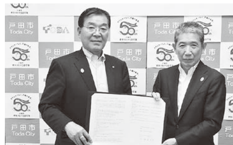
協定を締結した大和田町長(左)と神保市長

この協定は、災害時のみならず、平常時のさらなる交流の活発化に寄与するものと期待されます。