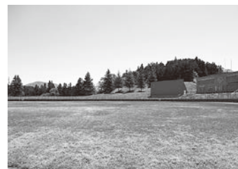
野球場(外野芝生部分)