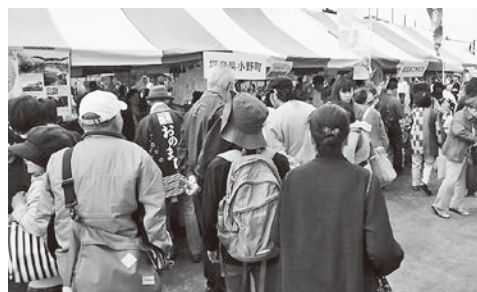
多くのお客さんでにぎわった小野町ブース