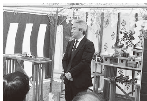
あいさつをする小松崎社長