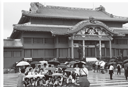
首里城見学では、あいにくの雨に見舞われてしまいました