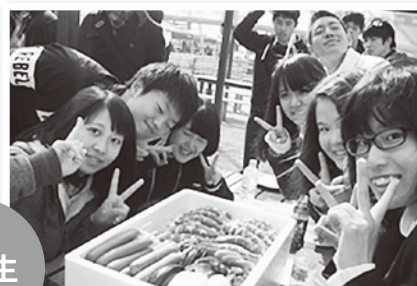
おいしそうな食材を前に、テンションの上がる3年生たち

11月13日、小野高校の1年生と3年生は遠足に行きました。1年生の行き先は仙台方面。今年開業したばかりの「仙台うみの杜水族館」で、さまざまな魚や海獣を見学してきました。3年生は大洗方面へ。大洗リゾートアウトレット内の全天候型BBQ施設「マルトBBQ」でバーベキューを堪能しました。