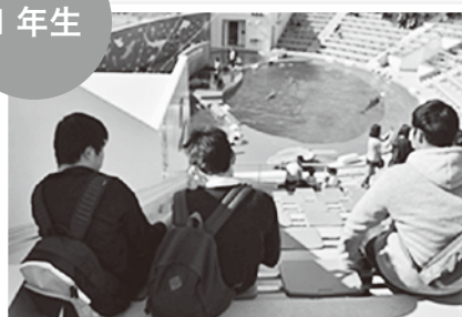
アシカのショーや大水槽を見学して、心が癒されるひとときを過ごしました