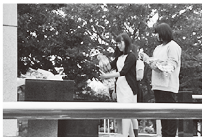
ひめゆりの塔で献花する生徒たち

11月11日～14日の3泊4日の日程で沖縄方面に修学旅行に行ってきました。ひめゆりの塔・平和祈念資料館では、沖縄のすさまじい戦禍の跡を目の当たりにすることで、平和について考える良い機会となりました。また美ら海水族館の見学や伊江島での民泊体験では、沖縄の美しい自然や独自の文化に触れることができ、充実した4日間となりました。