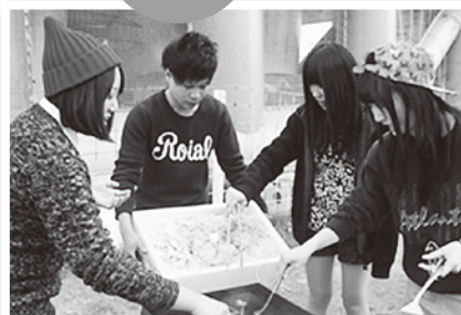
8台の鉄板に分かれて、焼き肉・焼きそばを調理しました