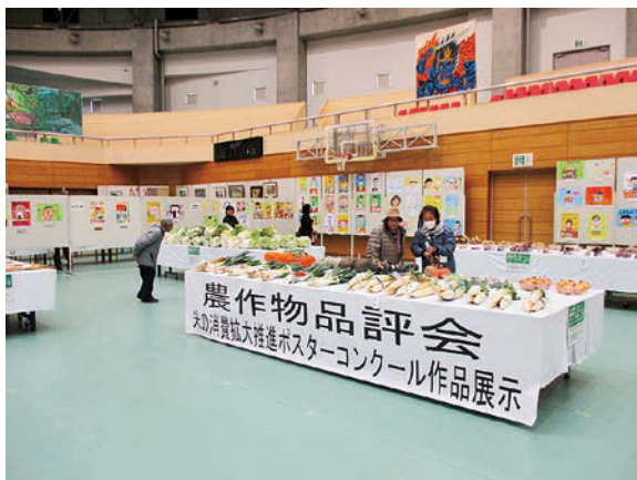
小町ふれあいフェスタ会場内での展示の様子