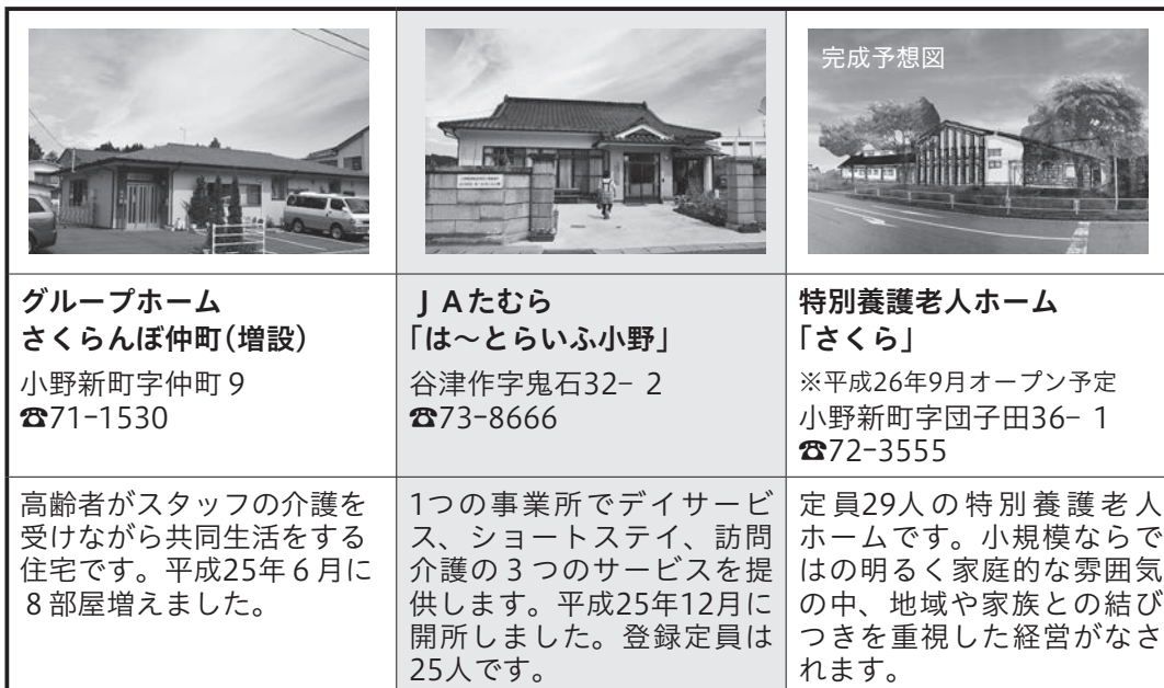
表1. 介護保険の事業所(第5期計画期間に整備された事業所)

平成24年度から始まった小野町第5期介護保険事業計画も計画期間の最終年度となりました。今回は皆さんに、小野町の高齢者の状況や介護施設の整備状況、介護サービスの利用の仕方などをお知らせします。